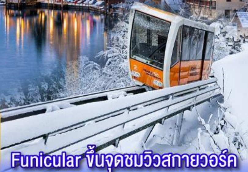
Funicular ขึ้นจุดชมวิวกายวอร์ด

พิเศษ!! ขึ้นกระเช้า Funicular สู่จุดชมวิวกองหมู่บ้านอัลสตัดและเที่ยวเมืองกราช