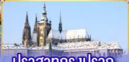
ปราสาทกรุงปราก