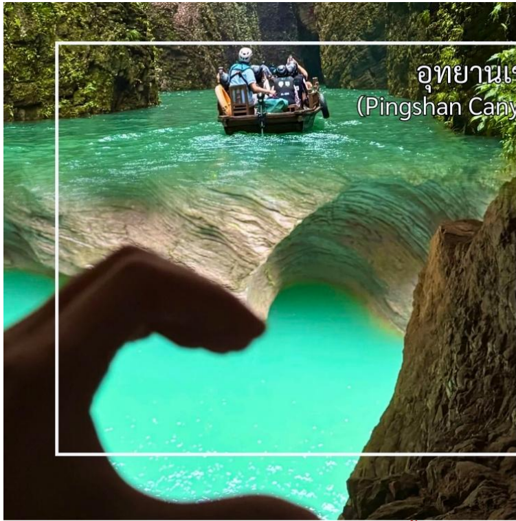
อุทยานเขาฝิงซาน (Pingshan Canyon Scenic Area)