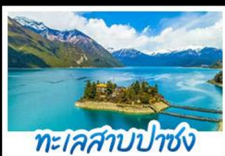
ทะเลสาบปาซง

รถไฟสายหลังคาโลก พระราชวังโปตาลา วัดโจคัง - ทะเลสาบปาซง พระราชวังฤดูร้อนนอร์บูลิงคา