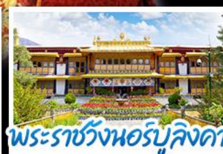
พระราชวังนอร์บูลิงคา