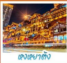
แสงยามดึก

อุทยานหลุมฟ้าสพานสวรรค์ • อุทยานเขานางฟ้า • หงหยาดัง • ดึกฟูยจิง ชั้น 22 • วัดต้าฉือ ชมรถไฟทะเล-สุตึก • สะพานโบราณหนานเฉียว • เมืองโบราณกวงเซี่ยน • อุทยานภูเขาสี่ศรีณี อุทยานตำกู่ปิงชาน • จตุรัสหยางเทียนหวู่ • รูปปั้นหมี่เพนค้ำบอมเซาพี • ร้านหมี่สิงจวงซูเก้อ ถนนคนเดินซุนซีลู่ • หมี่เพนค้ำบอมคัก IFS • ถนนไม้กู่หลี่ • ถนนโบราณชอยกวางชอยแคบ