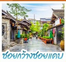
ชอยกวางชอยแคบ