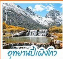
อุทยานน้ำแฉิงโก