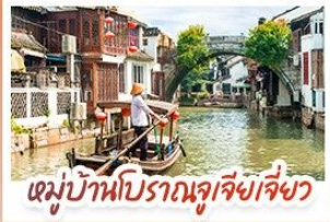
หมู่บ้านโบราณจูเจี๋ยเจี๋ย

สวนสนุกเซี่ยงไฮ้ดิสนีย์แลนด์ เต็มวัน (รวมรถรับ-ส่ง)