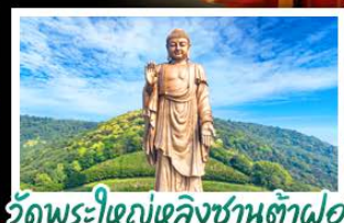
วัดพระใหญ่หลงซานต้าฝอ