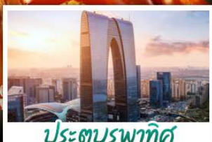
ประตูบูรพาทิศ