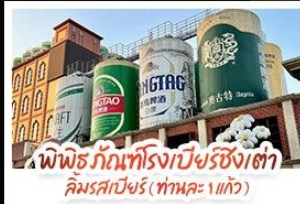
พิพิธภัณฑ์โรงเบียร์ชิงเต่า คิมครเบียร์ (ท่าทะเล 1 แก้ว)