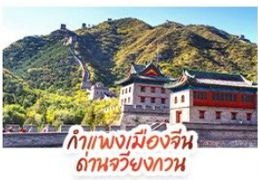
กำแพงเมืองจีน ด้านจวิ้นกวาง

ล่องเรือสุดโรแมนติกแม่น้ำหวงผู้ ปักกิ่ง..เปิดประตูสู่แดนมังกร ด้วยความอลังการระดับจักรพรรดิ ชิงเต่า..เมืองชายทะเลสไตล์ยุโรป หอระฆังแบบพอนทอเลีย เซี่ยงไฮ้..มหานครแห่งเอเชีย เมืองที่ไม่เคยหลับใหล