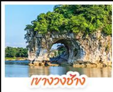
เงามวงช้าง