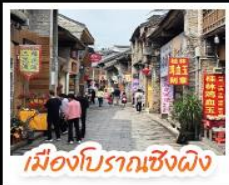
เมืองโบราณชิงผิง

เขื่อนจินเจดีย์ไฮไลท์ทัยหลิน เจดีย์จินเจดีย์ทอง เงามวงช้าง นั่งเคเบิลคาร์สู่ เหวหรือ จุดชมวิวกะหลกเวา แห่งเมืองหยางซิว ล่องเรือแม่น้ำลิวเจียง ตามรอยช้างหลังภาพรมบัตร 20 หยวน อิสระช้อปปิ้งถนนคนเดิน 2 แห่ง ถนนตงซีเซียง ถนนซีเจีย นั่งกระเช้าอลูนชมวิวกแบบ 360 องศา