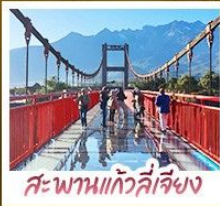
สะพานแกว่งลี่เจียง