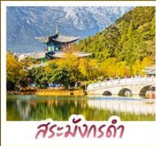
สระมังกรด้า