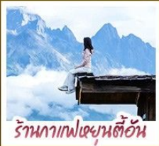
ร้านอาหารเชยุนตี้อัน

ชมวิวภูเขาหิมะ-เหมยลี่สุดโรแมนติกกับแสงยามพลบค่ำ เที่ยวเมืองโบราณต้าหลี่ ลี่เจียง ไปซา แซงกรี่ล่า ชมวิถีชีวิตของชุมชนยูนนานและทิเบต พิสูจน์ความกล้าท้าคืนชมสะพานแกว่งลี่เจียง • ซุปป์ิงพลินที่ถนนคนเดินหนานผิงเจียง