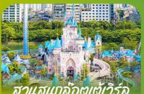
สวนสนุกโลกอเทเวียร์ค Lotte Adventure World