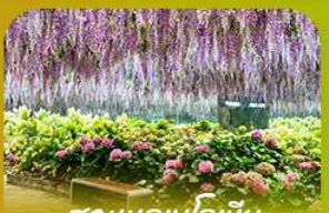
สวนนกบึงโกเมียง