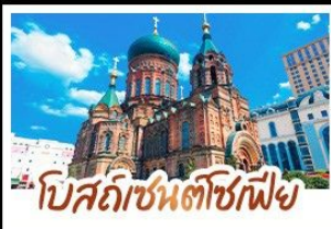
โบสถ์อิชินตโซฟีเย