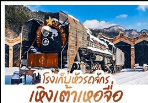
โรงเก็บขบวนจักร, เจียงเต๋าเออจื่อ