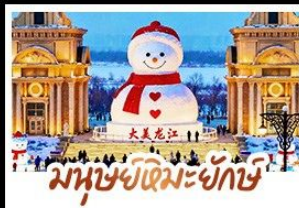
มนุษย์หิมะยักษ์