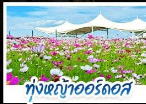
ทุ่งหญ้าเออร์โดส