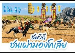
ชมวิถี ชนเผ่ามองโกเลีย

เปิดประสบการณ์ พักกระโจมมองโกลสุดพรีเมียมกลางทุ่งหญ้า สัมผัสบรรยากาศพระอาทิตย์ขึ้นสุดโรแมนติก ชมวิถีชนเผ่ามองโกเลีย พร้อมปาร์ตี้กองไฟใต้ท้องฟ้าเต็มไปด้วยดาว • ตะลุยทะเลทรายอินคินทาลา ถ่ายรูปสุดปังกลางทะเลทรายสีทอง • เที่ยวครบทั้งทุ่งหญ้าเออร์โดส วัฒนธรรมมองโกล และเมืองสุดโมเดิร์นในกรุงเป่ย์จิว แบบสวยหรู ดูแพงทุกวัน