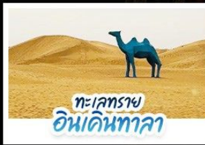
ทะเลทราย อินคินทาลา