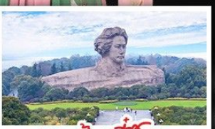
เกาะสึมจวิจโจว