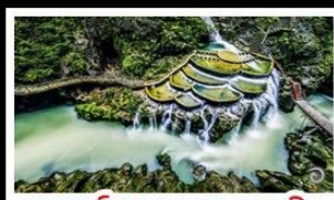
แกรนด์แคนยอนหงหนาน

เขาฟานจิ้ง - เมืองโบราณฝูหรงฉิน เมืองโบราณเฟิ่งหวง - เกาะสึมจวิจโจว แกรนด์แคนยอนหงหนาน - ไม้เท้าร้านช้อปปิ้ง พักโรงแรม 5 ดาว - รถไฟความเร็วสูง