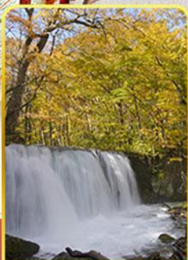
ลำธารโออิราสะ