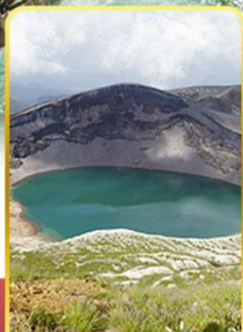
ปากปล่องภูเขาไฟฮาโอะ