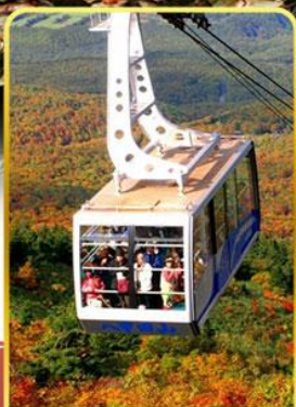
นั่งกระเช้าฮักโกดะ