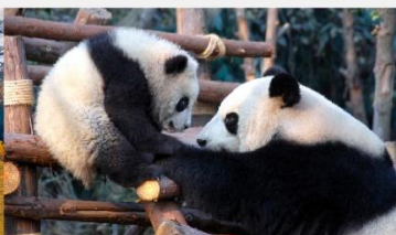
หุบเขาแพนด้าตูเจียงเอี้ยน