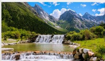
อุทยานแห่งชาติปี้เผิงโกว