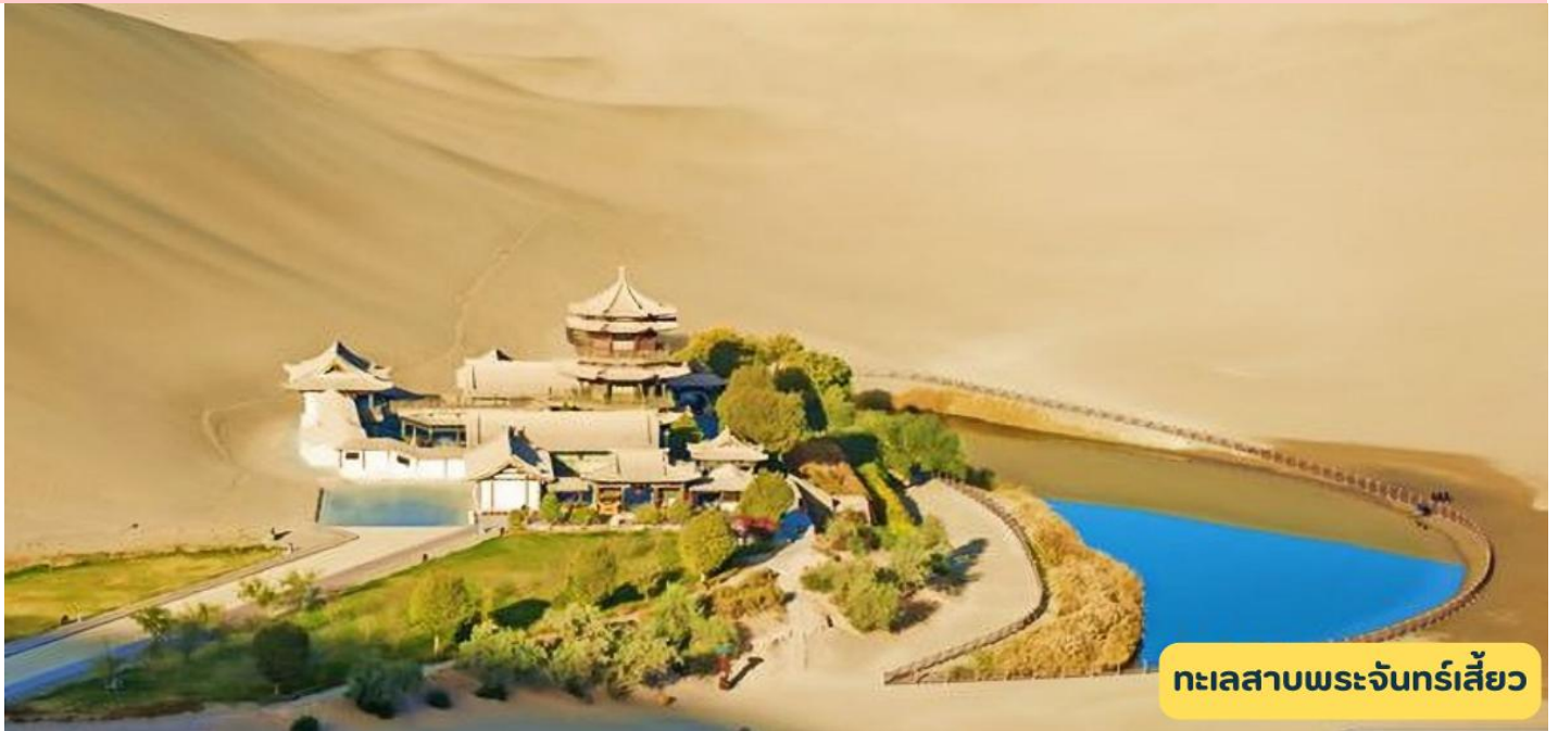
ทะเลสาบพระจันทร์เสี้ยว