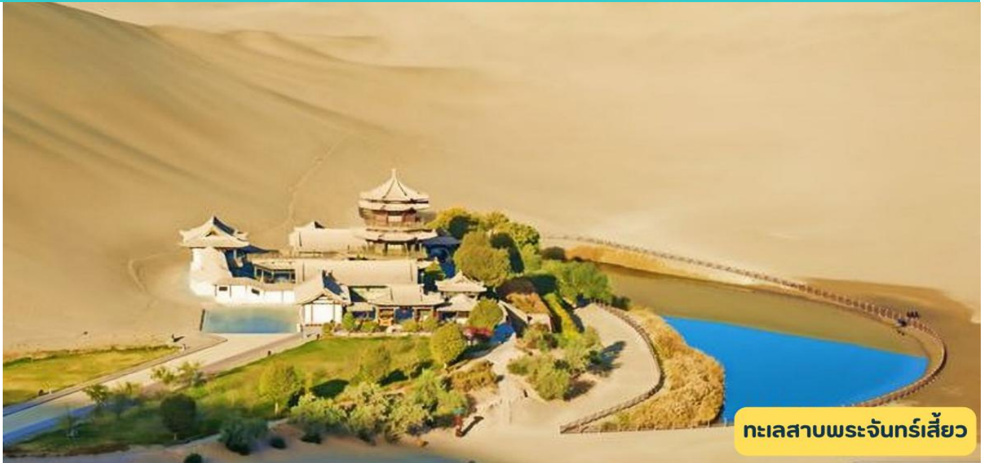
ทะเลสาบพระจันทร์เสี้ยว