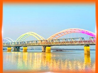
สะพานรถไฟพินโจว