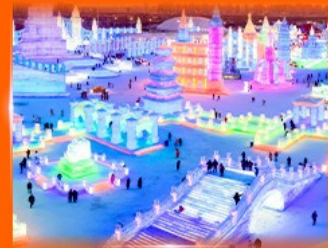
เที่ยว ICE & SNOW WORLD