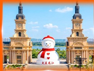
ตุ๊กตาสหิมะยักษ์ ฮาร์บิน