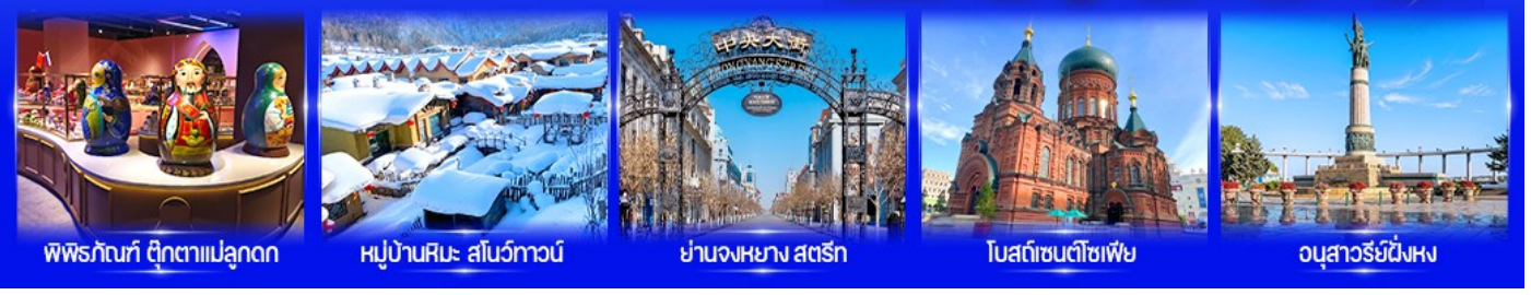
พิพิธภัณฑ์ ตุ๊กตาเป่ลุดก