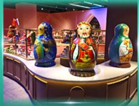
พิพิธภัณฑ์ ตุ๊กตาเป็ลูกดก