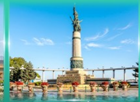
อนุสาวรีย์ฉิงเฟ