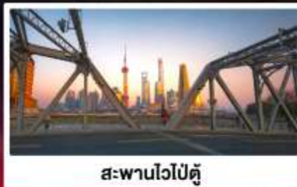
สะพานไวปี้ตู่