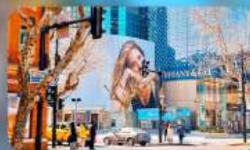
ถนนทวยไห่มีดเคิลโรด