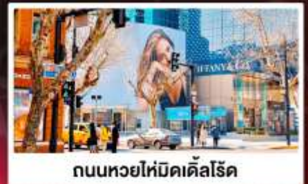
ถนนทวยไทมิดีลโรด