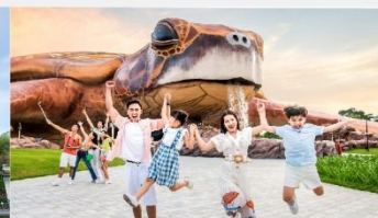
วินเพิร์ล อควาเรียม

*ทางบริษัทฯ ขอสงวนสิทธิ์ในการสลับโปรแกรมทัวร์ตามความเหมาะสมขึ้นอยู่กับสถานการณ์หน้างาน โดยคำนึงถึงผลประโยชน์ของลูกค้าเป็นสิ่งสำคัญ