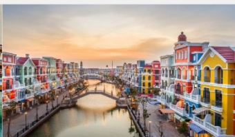
แกรนด์เวิลด์ฟูท๊วก