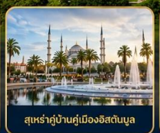
สุเหร่าบ้านคูเมืองอิสตันบูล