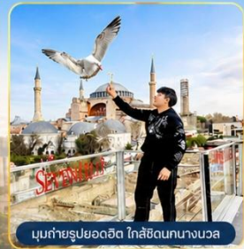
มุขถ่ายรูปยอดฮิต ใกล้ฮิลตันนางนวล