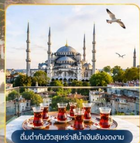
ต้นตากับวิวกุหลาบสีน้ำเงินฮิลตันนางนวล