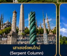
เสาเซอร์เพนไทน์ (Serpent Column)