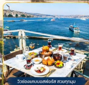
วิวช่องแคบบอสฟอรัส สวยทุกมุม