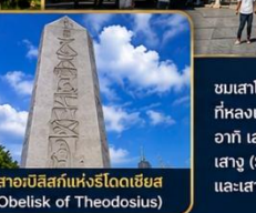
เสาอเบลิสก์แห่งโรโดเดียม (Obelisk of Theodosius)