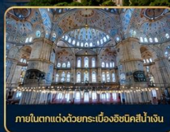
ภายในตกแต่งด้วยกระเบื้องอิซนิคสีน้ำเงิน