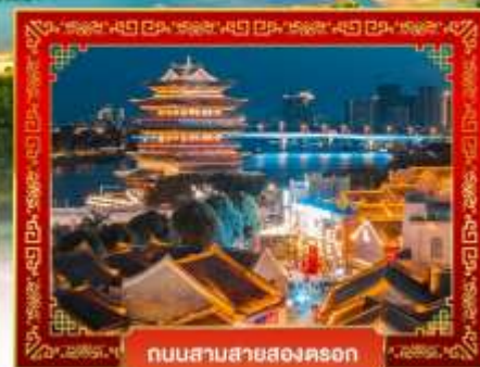
ถนนสามสายสองคอน