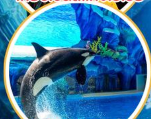
Orca Show สุดน่ารัก