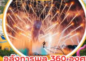
อสังการพลุ 360 องศา