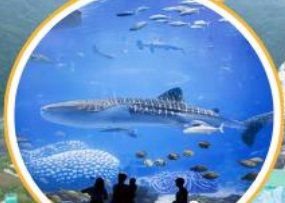
อะควาเรียมใหญ่ที่สุดในโลก