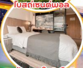
พัก 2 คน!!