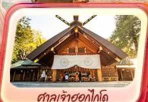
ศาลเจ้าซอกโกโต