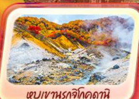
เขมเขานรจิโกดธานี