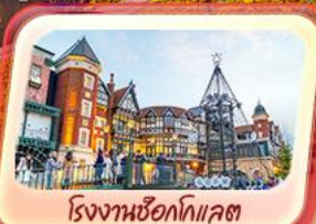
โรงแรมซ็อกโกแลต