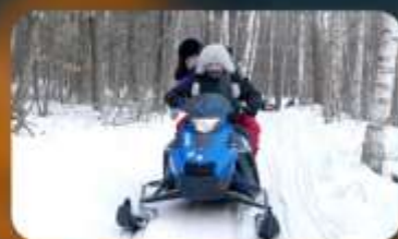
จักรยาน SNOW MOTORCYCLE