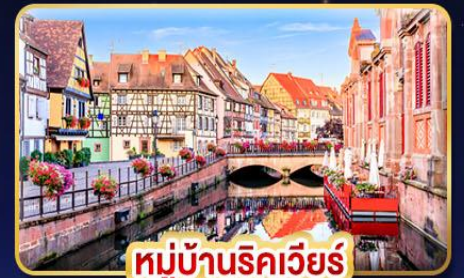
หมู่บ้านริคเวียร์