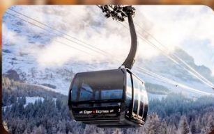
ขึ้นกระเช้า Eiger Express สู่ยอดเขาจุงเฟรา