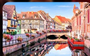
หมู่บ้านริควีเยร์