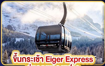
ขึ้นกระเช้า Eiger Express สู่ยอดเขาจุงเฟรา