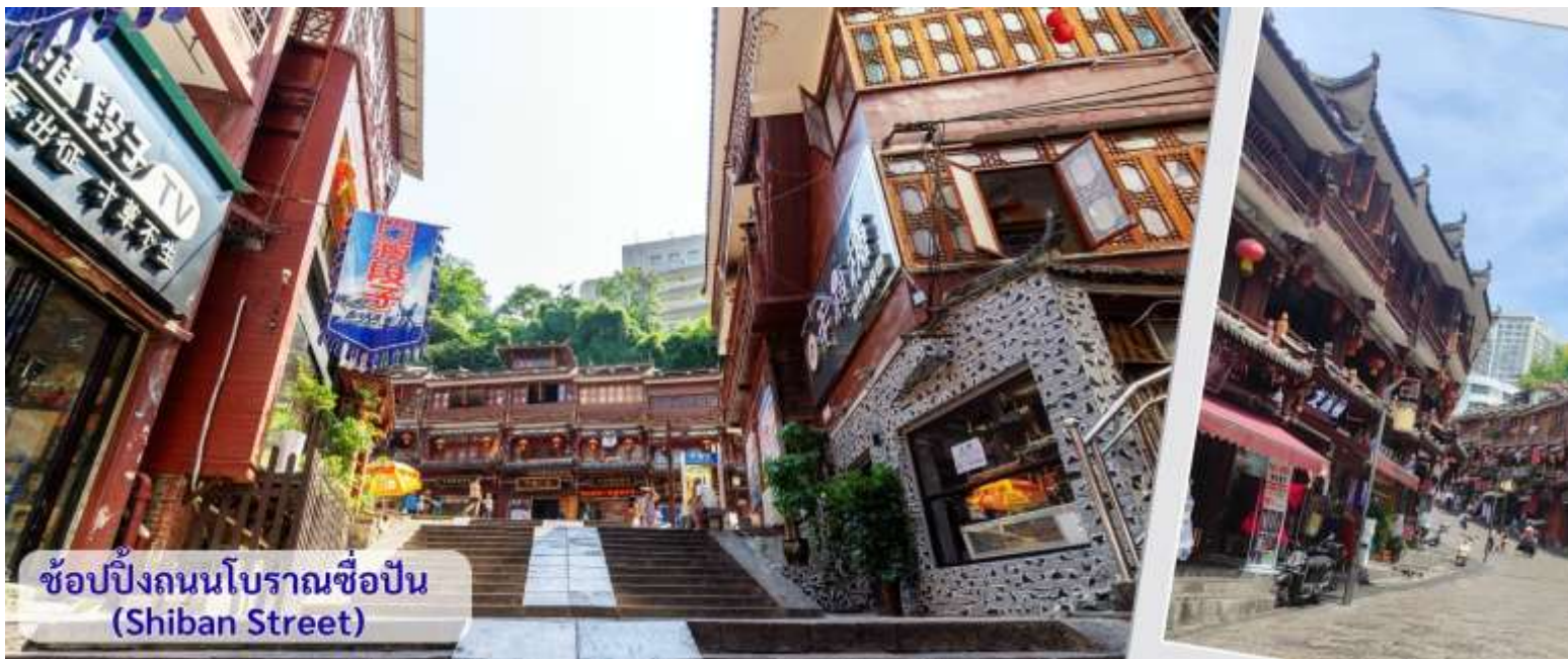
ช้อปปิ้งถนนโบราณช้อปปิ้ง (Shibans Street)

จากนั้นนำทุกท่าน เดินถนนโบราณ Feng Hueng Ancient Town ที่ถนนช้อปปิ้ง Shibans Street เมืองที่ยังคงรักษาเอกลักษณ์ความเป็นพื้นเมืองผสมผสานกับยุคปัจจุบันเอาไว้ได้อย่างลงตัววิถีชีวิตของชาวบ้านที่อาศัยอยู่ที่นี่ บรรยากาศในเมืองเฟิ่งหวง ถนนเก่าช้อปปิ้งเป็นถนนปูหินแคบๆ กว้างไม่ถึง 5 เมตร ทอดยาวจากทางเข้าวัดเต้าเหมินไปทางทิศตะวันตก ผ่านถนนหลายสาย ได้แก่ ถนนคอรอส ถนนเจิ้งตะวันออก ถนนเจิ้งตะวันตก ศาลาสูยหลง หียงเซียวซง เต้าซาลา ศาลาเจี้ยกัว และสุสานเซินฉงหวิน สุดท้ายจะนำไปสู่ “น้ำพุแรกใต้ฟ้า” ถนนสายนี้มีความยาวกว่า 3,000 เมตร และเป็นย่านการค้าที่คึกคักที่สุดในเฟิ่งหวง