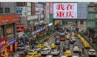
กวนอิมเจียว

*ทางบริษัทฯ ขอสงวนสิทธิ์ในการสลับโปรแกรมทัวร์ตามความเหมาะสมขึ้นอยู่กับสถานการณ์หน้างาน โดยคำนึงถึงผลประโยชน์ของลูกค้าเป็นสำคัญ