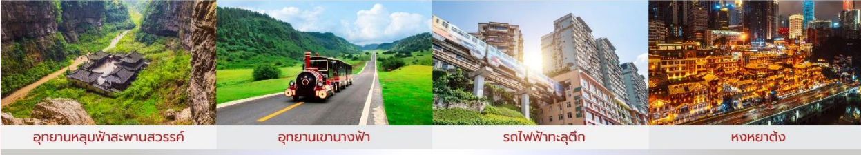
อุทยานหลุมฟ้าสะพานสวรรค์ อุทยานเขานางฟ้า รถไฟฟ้าทะเลตึก หงหยาดัง