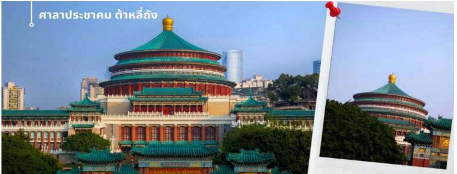
ศาลาประชาคม ต้าหลี่ถิง