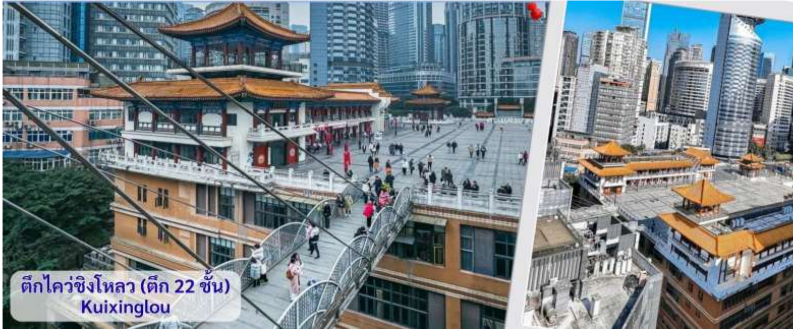
ตึกไควชิงโหลว (ตึก 22 ชั้น) Kuixinglou

จากนั้นอิสระถ่ายรูปหน้าตึกตะเกียบ ฉงชิ่ง(ด้านนอก) คือ ฉงชิ่งกั๋วไท่อาร์ตเซ็นเตอร์ (Chongqing Guotai Arts Center) เป็นแลนด์มาร์กสำคัญที่มีสถาปัตยกรรมคล้ายตะเกียบยักษ์สีแดงและดำวางซ้อนกัน เป็นศูนย์จัดแสดงงานศิลปะและสถานที่ท่องเที่ยวที่นิยมสำหรับการถ่ายรูป โดยเฉพาะในเวลากลางวันเมื่อเปิดไฟสวยงาม สิ่งก่อสร้างอันมีเอกลักษณ์ อาคารนี้ถูกวางโครงสร้างให้มีรูปร่างคล้ายกอง "ตะเกียบยักษ์" สีดำและแดงที่วางซ้อนกันเป็นชั้นๆ ที่ส่วนปลายของตะเกียบสีแดงจะมีตัวอักษรจีนคำว่า "กั๋ว" ประทับอยู่ ซึ่งมีความหมายถึง ชาติหรือประเทศ ส่วนที่ปลายตะเกียบสีดำ จะมีอักษรจีนคำว่า "ไท่" ประทับอยู่ ซึ่งหมายถึง ความเจียบสงบ หรือความอุดมสมบูรณ์