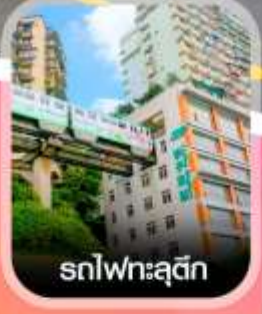
รถไฟทะเลตี้ก

✈️ คอนเฟิร์มออกเดินทาง ทุกพีเรียด 2 ท่านขึ้นไป