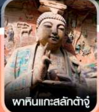
พาคินแกะสลักต้ำจู้