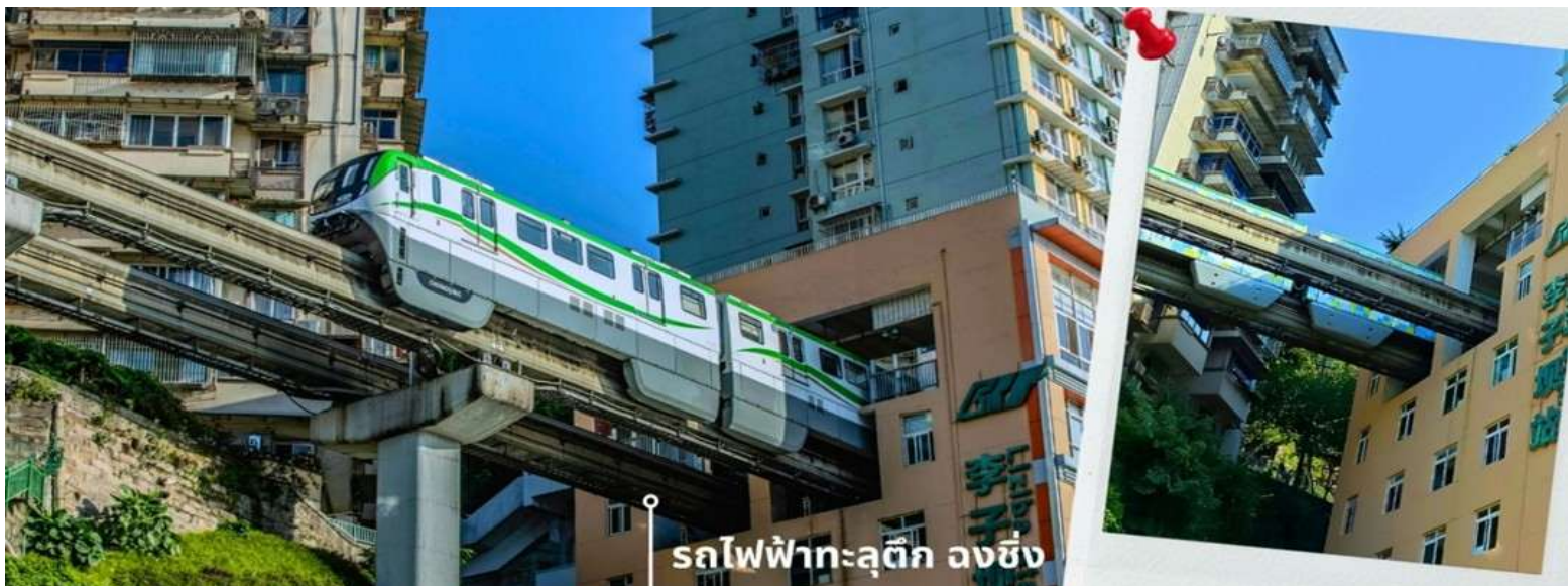
รถไฟฟ้าทะเลตึก ฉงชิ่ง

จากนั้นนำท่านนั่งรถไฟฟ้าทะเลตึก หรือ สถานี Liziba เป็นสถานีรถไฟฟ้าแบบขานชาลา สิ่งที่ทำให้สถานี Liziba มีชื่อเสียงไปทั่วโลกคือ “เส้นทางรถไฟที่วิ่งทะลุผ่านอาคารสูง 19 ชั้น” โดยมีระบบลดเสียงและแรงสั่นสะเทือน ทำให้ผู้ที่อาศัยอยู่ในตึกไม่ได้รับผลกระทบจากเสียงดังมาก กลายเป็นภาพอันน่าตื่นตาตื่นใจของผู้ที่มาเยือนทั้งนักท่องเที่ยวที่เดินทางมาเป็นครั้งแรก ผู้โดยสารบนขบวนรถไฟและผู้เข้าชมจากจุดชมวิวก็ต่างตื่นเต้นไปตามๆกันกับการที่ได้เห็นรถไฟวิ่งทะลุตึกนี้ สถานี Liziba ได้รับการยกย่องให้เป็น 1 ในสถานที่สำคัญที่สะท้อนความเติบโตของจีนตลอด 70 ปี ซึ่งไม่ได้เกิดขึ้นโดยบังเอิญ รถไฟฟ้าทะเลตึกนี้คือตัวอย่างของความอัจฉริยะในการออกแบบการคมนาคมในเมืองภูเขาแห่งนี้ให้ท่านได้สัมผัสประสบการณ์กับการขึ้นนั่งบนรถไฟเพื่อผ่านทะเลตึกและเก็บภาพบรรยากาศ