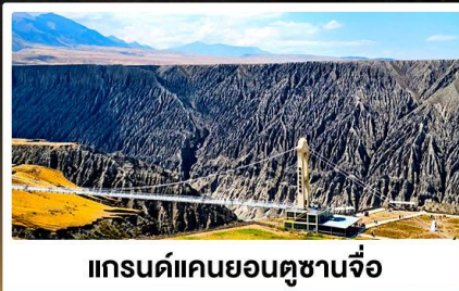
แกรนด์แคนยอนตูซันจื่อ