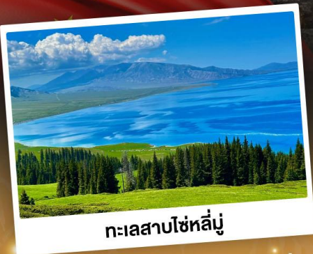
ทะเลสาบไซหลิน

ชมวิวสุดอลังการแบบยุโรปผสมเอเชีย กุ้งหลุนาเขียวฉ่ำ ทะเลสาบสีเทอร์ควอยซ์