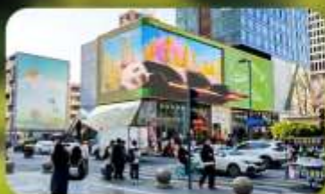
ไท่กู่หลี่