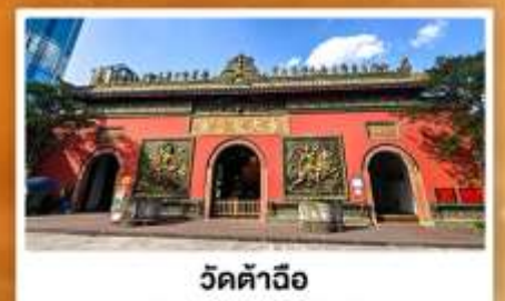
วัดคำจื่อ