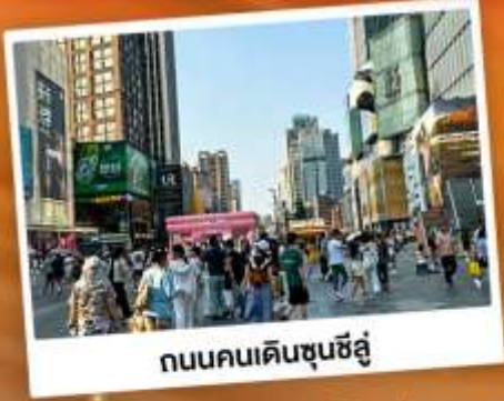
ถนนคนเดินชุนชี่อู่

"สวีตเซอร์แคด์เน็ช" แคนมังกร แหล่งท่องเที่ยวทางธรรมชาติระดับ 4A