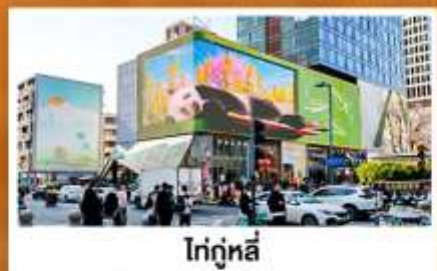
โทกูหลี่