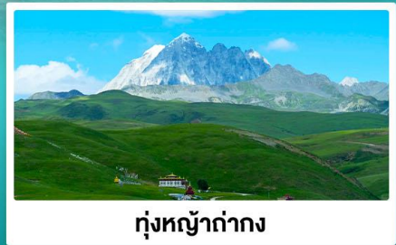
ทุ่งหญ้าง่าง