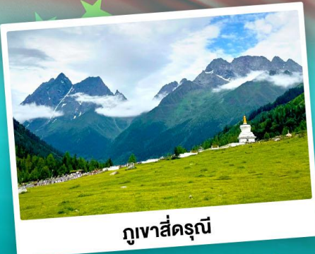
ภูเขาสิ่ดรุณี

ชมความสวยงามทุ่งหญ้ากว้าง เทือกภูเขาสิ่ดรุณี อุทยานयाตัง "แซงกรีจ้าแห่งสุดท้าย" S-ดับ 5A