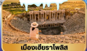
เมืองเฮียราโกลิส