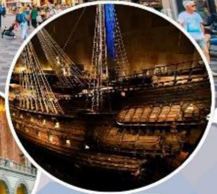
เข้าชม "พิพิธภัณฑ์เรือวาซา"