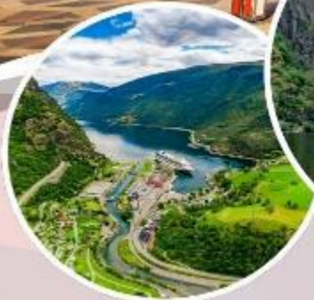
นั่งรถไฟสายโรแมนติก "Flamsbana"