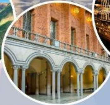
เข้าชมศาลาว่าการ กรุงสต็อกโฮล์ม