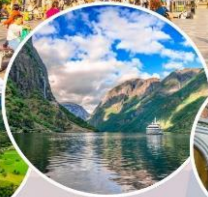
ล่องเรือ "Nærøyfjord"