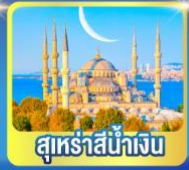
สุหรั่าน้ำเงิน