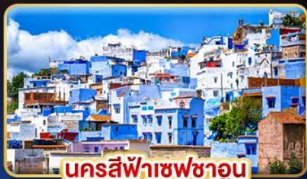
นครสีฟ้าเซฟซาอูน

ท่องเที่ยวดินแดนฟ้าจรดทราย เก็บทุกไฮไลท์ใน โมร็อกโก อารยธรรมสุดขบถทวีป