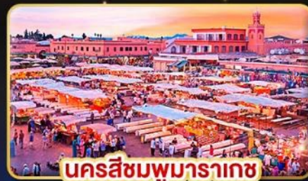
นครสีชมพูมารากษ