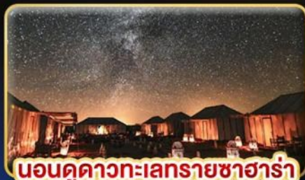
นอนดูดาวทะเลทรายซาฮารา