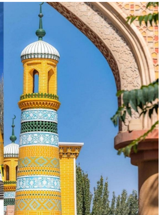
มัสยิดอิตก้าห์ (Id Kah Mosque)