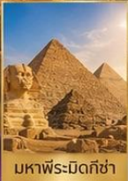
มหาพีระมิดกิซ่า