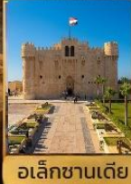
อเล็กซานเดีย