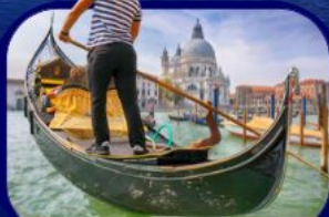
เที่ยวเกาะเวนิส