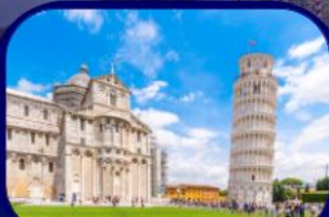
หอเอนแห่งเมืองปิซ่า