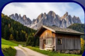
อุทยานฯ โดโลไมท์