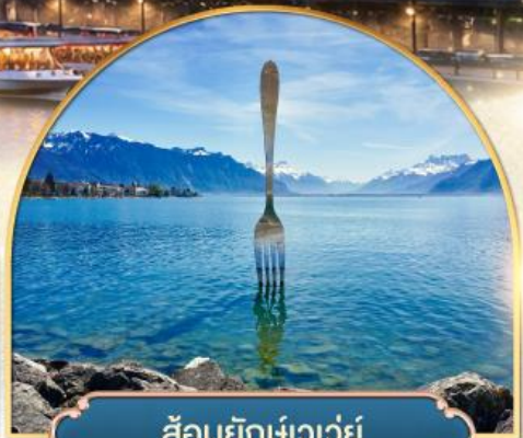
ส้อมยักเข่าเว้ย