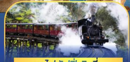
รถไฟฟ้างูบิลลี่

ล่องเรือชมอ่าวซิดนีย์พร้อมรับประทานอาหารกลางวัน และ เข้าชมสวนสัตว์การองก้า