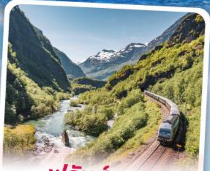
ฟลัมส์บานา รถไฟเส้นทางสายโรแมนติก