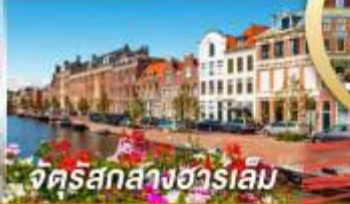
จัดรีสกลาสฮาร์เล็ม