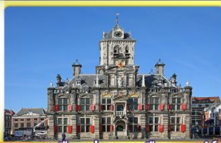
อาคารเมืองเก่าคลองเมืองเคลฟท์