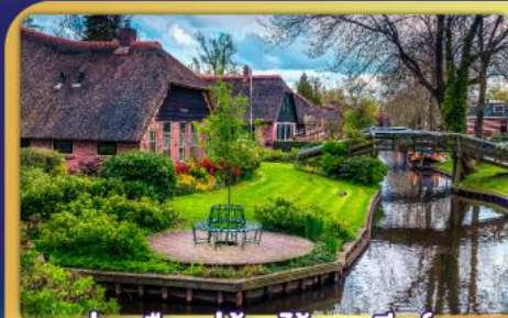
ล่องเรือหมู่บ้านไรกนทึร์ฮัน