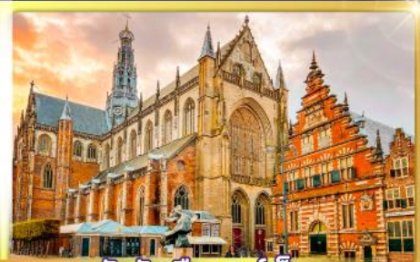
จัตุรัสเมืองฮาร์เล็ม

พรมแดนเมืองแปลกเนเธอร์แลนด์และเบลเยียม เดินเมืองเคลฟท์ เมืองเครื่องปั้นดินเผาระดับโลก ฮาร์เล็มเมืองมั่งคั่งที่สุดของเนเธอร์แลนด์