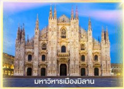
มหาวิหารเมืองมิลาน