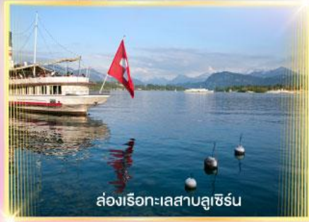
ล่องเรือทะเลสาบลูซิิร์น