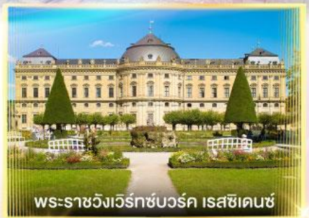
พระราชวังแวร์ซายส์ ไรชชิ่งเฮาส์